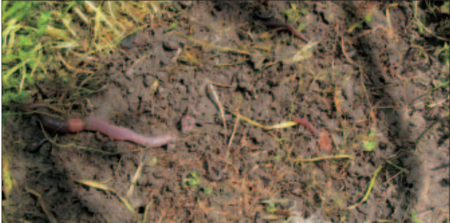
Böden als Lebensgrundlage zahlreicher Organismen

oder Erhaltung der Leistungsfähigkeit der Böden aufgebracht. Bei unsachgemäßer Aufbringung von Materialien können Böden aber auch irreversibel geschädigt oder gar zerstört werden.