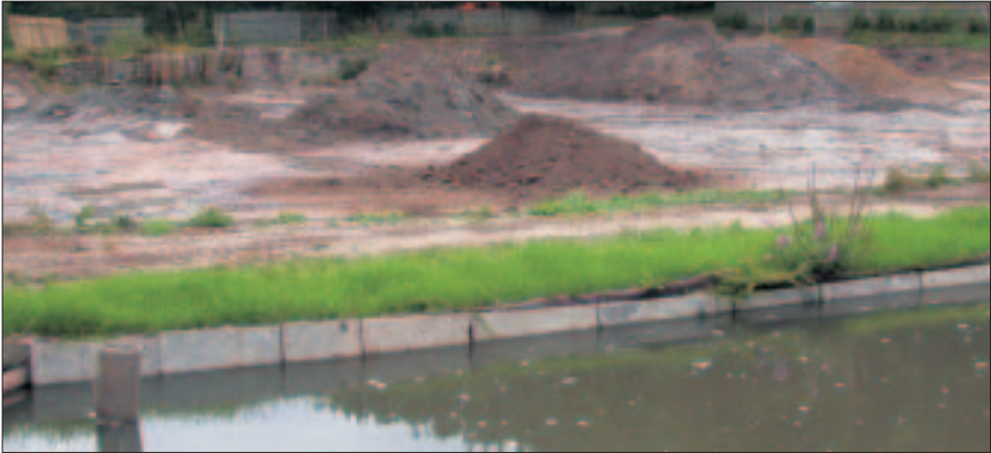
Baggergut – Entschlammung eines verlandeten Teiches

In Thüringen fallen jährlich große Mengen an Bodenaushub, Baggergut, Klärschlamm und Bioabfall an, die bei entsprechender Eignung zu verwerten sind.