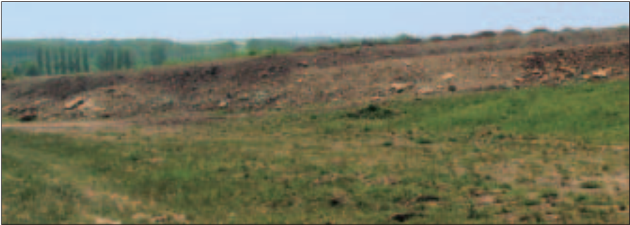
Einsatz von Bodenmaterial im Landschaftsbau - Geländeanpassung

einer durchwurzelbaren Bodenschicht aufgebracht werden.