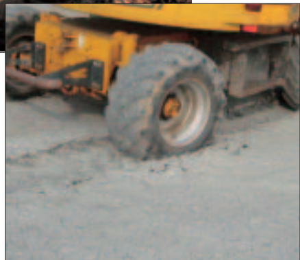
Verdichtung – eine Folge häufiger Befahrungen