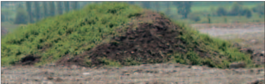
Humoses Bodenmaterial ist besonders geeignet

Nicht jedes Bodenmaterial ist für die Aufbringung geeignet. Grundsätzlich sind bestimmte chemische, physikalische und umwelthygienische Anforderungen zu erfüllen.