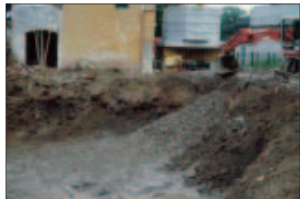
Aushub von Bodenmaterial

Beim Ausbau von Bodenmaterial ist zu beachten, dass Ober- und Unterboden sowie Bodenschichten unterschiedlicher Verwertungseignung getrennt ausgebaut und verwendet werden. Bestehender Pflanzenwuchs sollte zuvor entfernt werden.