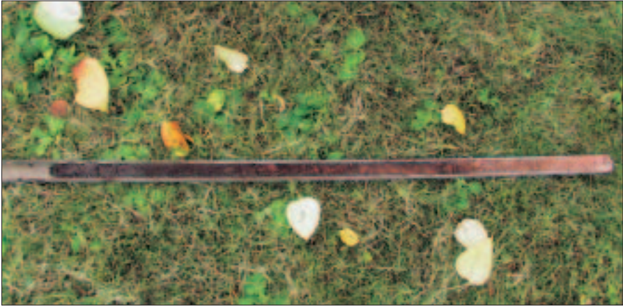
Ermittlung der Untergrundbeschaffenheit mittels Pürckhauer-Bohrstock