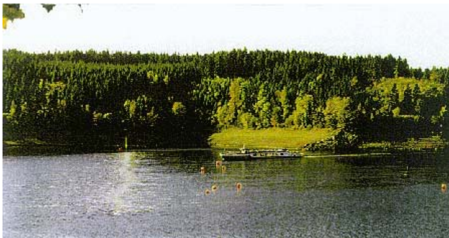
Blasenschleier an der Talsperre Bleiloch

Der Abschlussbericht "Künstliche Destratifikation einer hypertrophen Talsperre als ein Verfahren zur Begrenzung von Algen und Wasserlinsenwachstum" (TLU 2000) liegt vor.