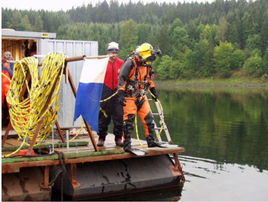
Vorbereitung für einen Tauchereinsatz

Zuerst wurden nacheinander die Ausgleichsgewichte, die Luftzuführungs- und Düsenleitung entfernt. Anschließend wurden die Tragseile und Ankerpunkte ausgebaut. Der ursprüngliche Zustand der Uferbereiche wurde wieder hergestellt.