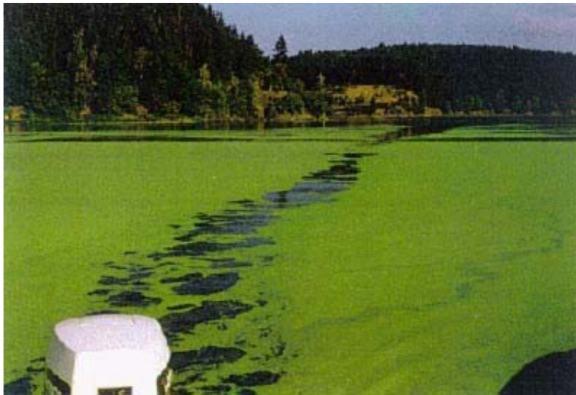
Massenentwicklung von Wasserlinsen in der Talsperre Bleiloch 1991

Seit 1989/90 führte die Reduzierung des Gelbstoffgehaltes (Braunfärbung) im Abwasser der Zellstoffindustrie am Zulauf der Talsperre zur Verringerung der Eigenfärbung des Wasserkörpers. Trotz großer Fortschritte bei der Abwasserbehandlung im bayerischen Teil des Einzugsgebietes liegt aber eine unverändert hohe Nährstoffbelastung (hypertroph) aus dem großen Einzugsgebiet der Saale vor. Die hohe Nährstoffbelastung und das bessere Lichtklima durch zunehmende Aufhellung führte nach 1989 zu einer deutlichen Zunahme der Primärproduktion, d.h. Zunahme der Algenentwicklung und 1991 zu einer Massenentwicklung von Wasserlinsen als grüner Teppich - mit den entsprechenden Folgeerscheinungen für den Sauerstoffhaushalt des Gewässers.