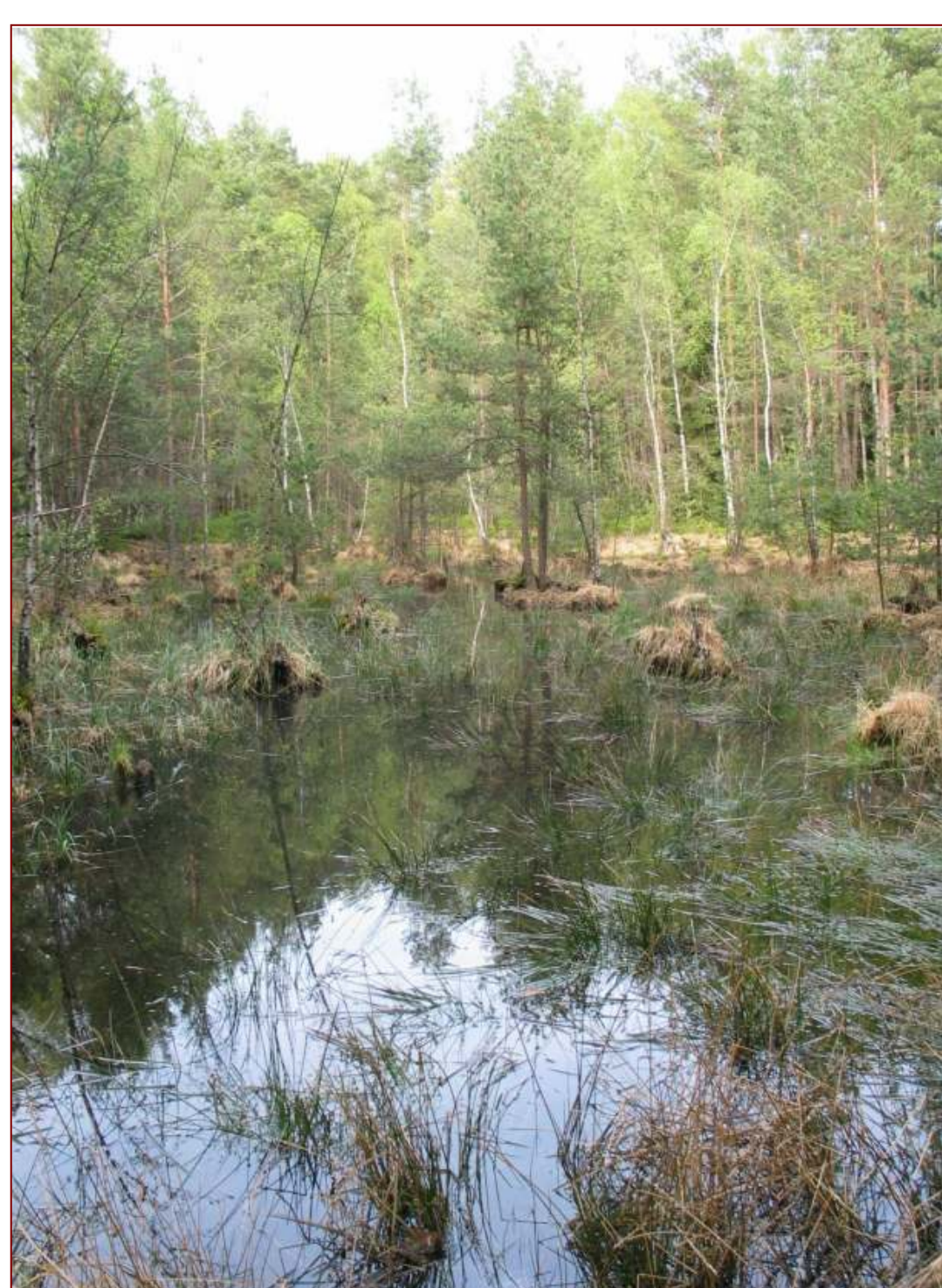
Abgetorfte Moor bei Hummelshain.

In Mooren sammelt sich besonders viel organisches Material . Der dort angehäufte Kohlenstoff erfährt durch den Wassereinfluss kaum Zersetzung. Durch die globale Erwärmung verändern sich die Feuchtebedingungen im Moor. Es wird trockener, so dass der Abbau der organischen Stoffe zu CO 2 einsetzt. Das Moor wird zu einer Kohlenstoffquelle.