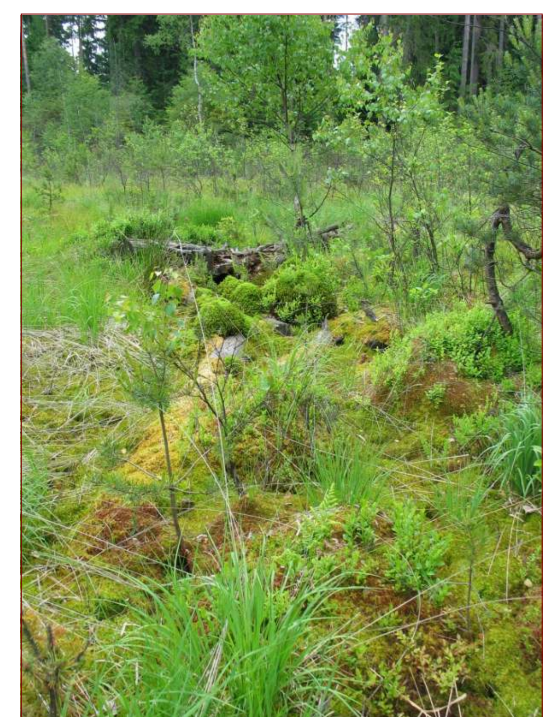
Hochmoor im Wolfersdorfer Forst

Während ein Hektar Boden des Thüringer Waldes bis zu 95 t Kohlenstoff beinhaltet, speichert allein das Hochmoor im Wolfersdorfer Forst etwa 1020 t organischen Kohlenstoff pro Hektar (Quelle: F. Behnsen).