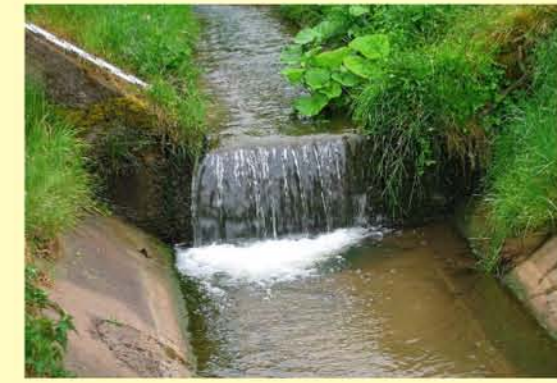
Waise bei Wernigerode/Mackenrode, Absturz ohne Durchgängigkeit