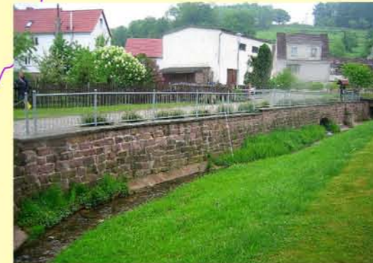
Waise in Mackenrode, Entwicklungseinschränkung durch einseitigen Schutz der Straße