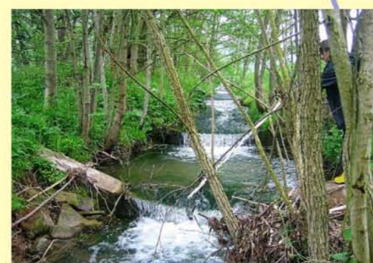
Waise unterhalb Vatterrode, Sohlriegel, als Abstütze nicht durchgängig