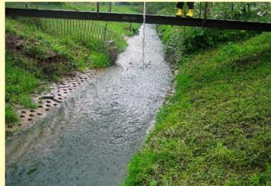
Waise in Wahlhausen, starke Uferbefestigung, Abflusshindernis