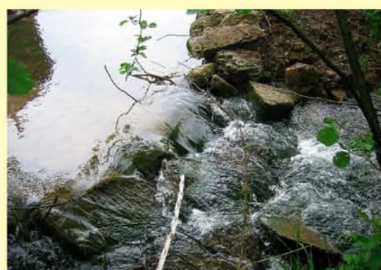
Sohlstufe in der Waise bei Dietzenrode, Wanderbarriere für Fische