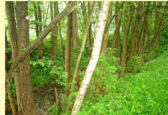
Waise oberhalb Wahlhausen, pflegebedürftiger Gehölzbestand