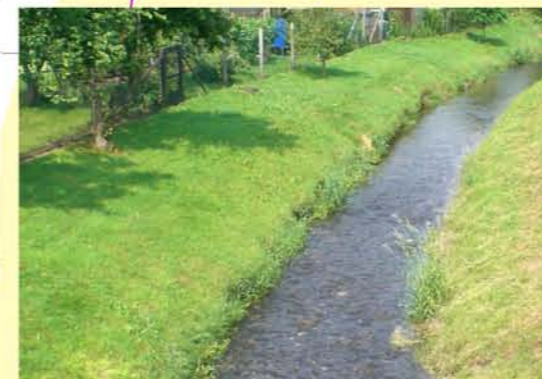
Eller (Geröder Eller), OL Zwinge, begradigtes Gewässer