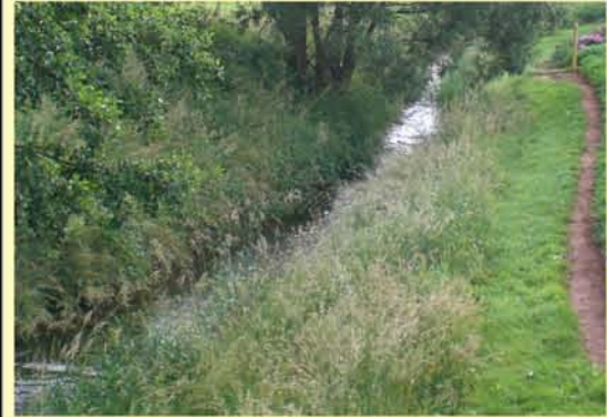
Eller, unterhalb OL Zwinge, begradigtes Gewässer mit Auenutzung