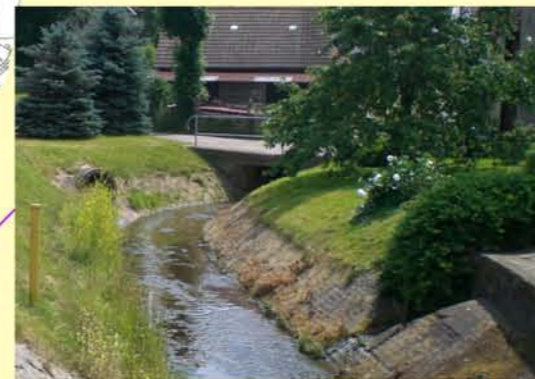
Eller (Geröder Eller) OL Lüderode, Uferverbau