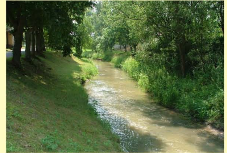
Rodach in Bad Colberg