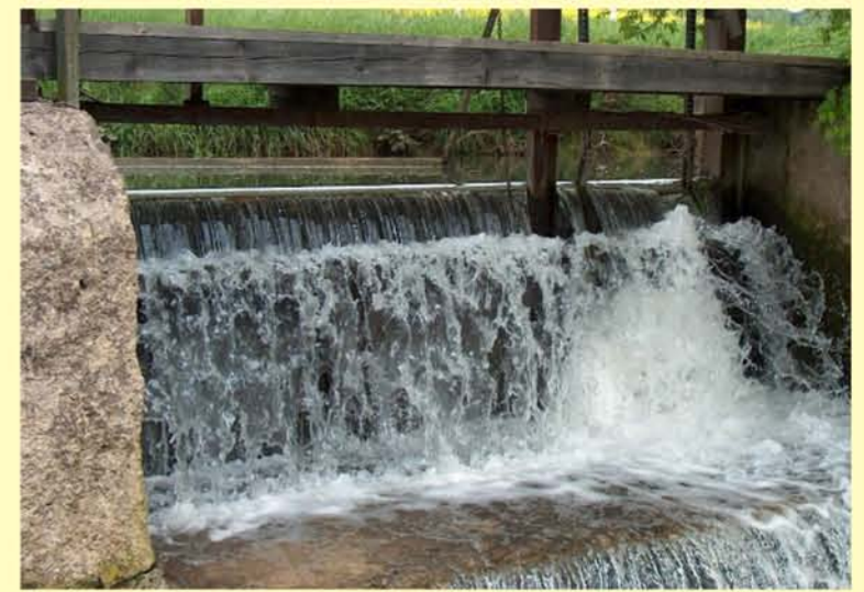
Rodach oh. Ummerstadt, Wehr Erlachsmühle