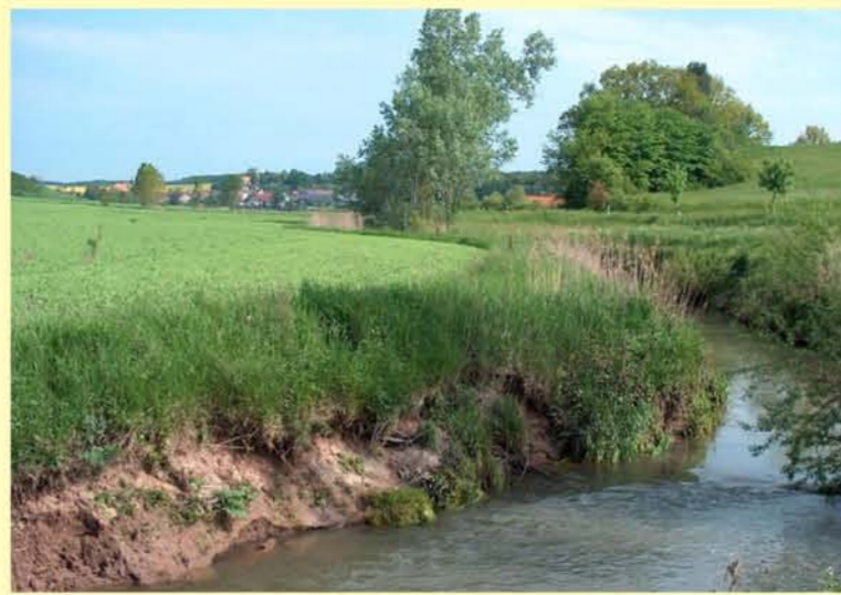
Rodach uh. Ummerstadt, Gewässer ohne Randstreifen