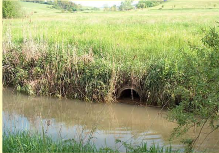
Rodach, verrohrte Nebengewässer