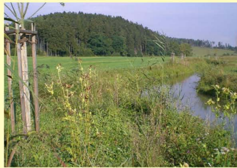
Rodach uh. Ummerstadt, renaturierter Gewässerabschnitt