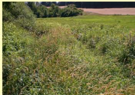
Zeilbach oh. Reurieth, fehlende Gehölze