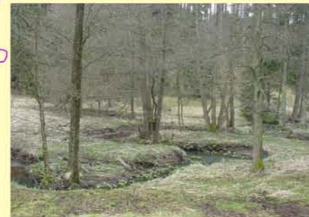
Beispiel naturbelassener Abschnitt, Auwald: Widersbach oh Widersbach,