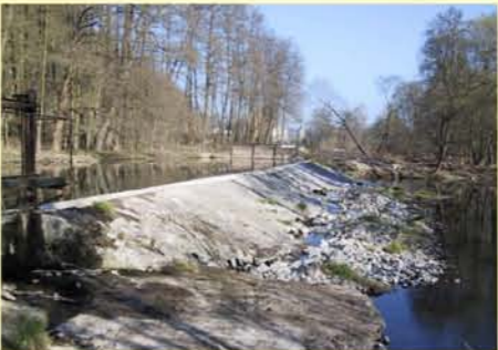
Werra, Wehr Obere Mühle Themar