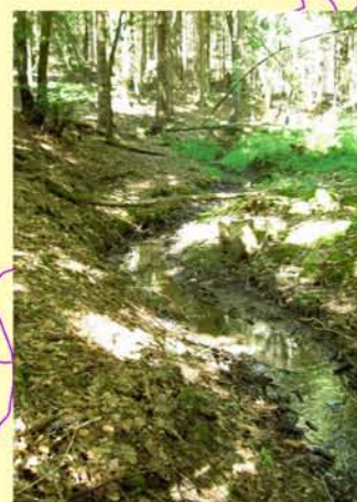
Beispiel für den Entwicklungszustand Gewässerstruktur: Hutschbach oh. Westenfeld, naturbelassener Abschnitt.