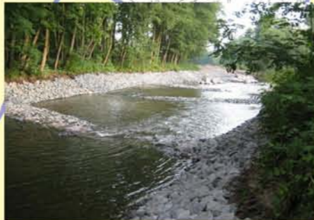
Werra, Umbau des Wehres Obere Mühle Themar zur Sohlgelerte