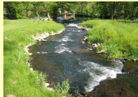
Werra, Umgehungsgerinne am Brückenmühlenwehr in Vachdorf