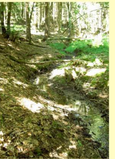
Beispiel für den Entwicklungszustand Gewässerstruktur: Hutschbach oh. Westenfeld, naturbellener Abschnitt