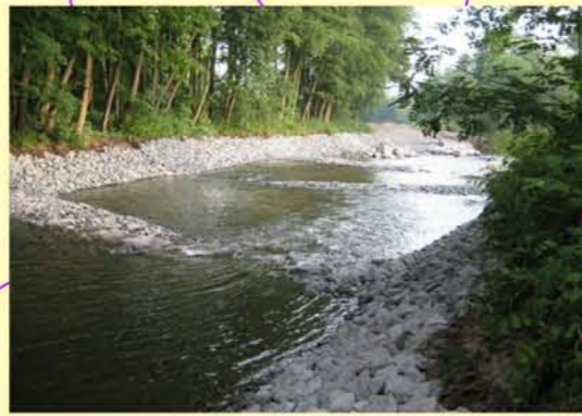
Werra, Umbau des Wehres Obere Mühle Themar zur Sohlgleite