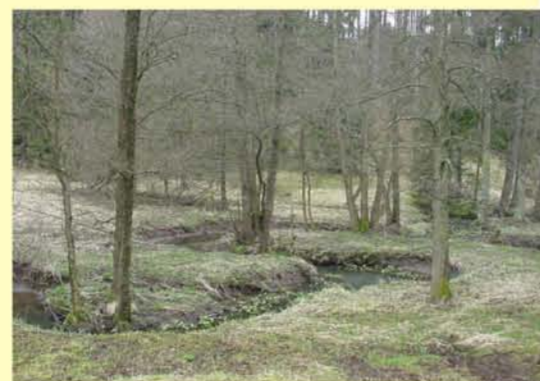
Beispiel naturbellener Abschnitt, Auwald: Wiedersbach oh. Widersbach,