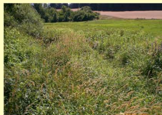
Zeilbach oh. Reurieth, fehlende Gehölze