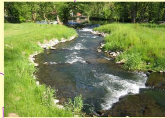
Werra, Umgehungsgerinne am Brückenmühlenwehr in Vachdorf