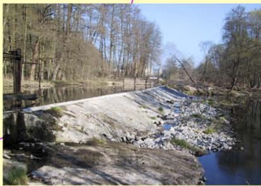
Werra, Wehr Obere Mühle Themar