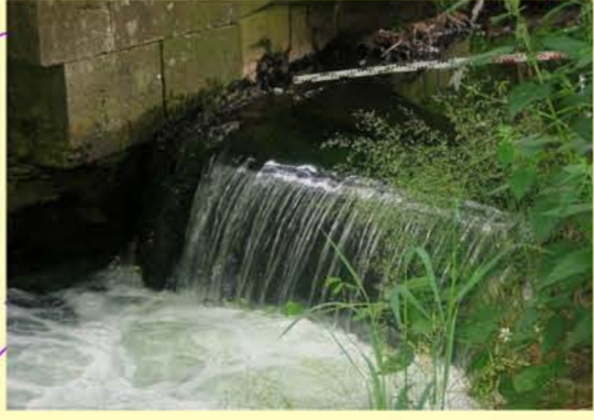
Herpf, Schlabsturz oh. Ortslage Herpf