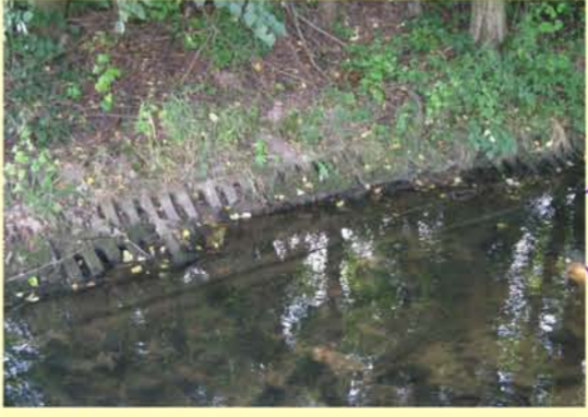
Katz uh. Mehms, stark ausgebautes Gewässer