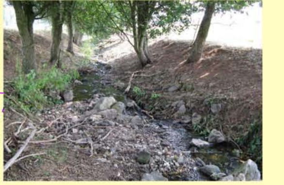
Bach aus Oepferthausen, ausgebautes Gewässer mit landwirtschaftlicher Nutzung