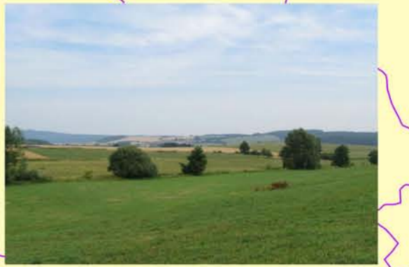
Rensbach uh. Hünfertshausen, Gewässerrandstreifen kaum ausgebildet