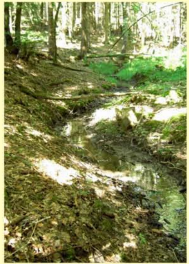
Beispiel für den Entwicklungszustand Gewässerstruktur: Hutschbach oh. Westenfeld, naturbelassener Abschnitt