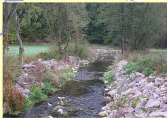
Beispiel für den Umbau eines Wehres in eine Gleite, Effelder oh. Döhlau, Ersatz eines ehemaligen Bewässerungwehres durch eine flache Sohlgleite