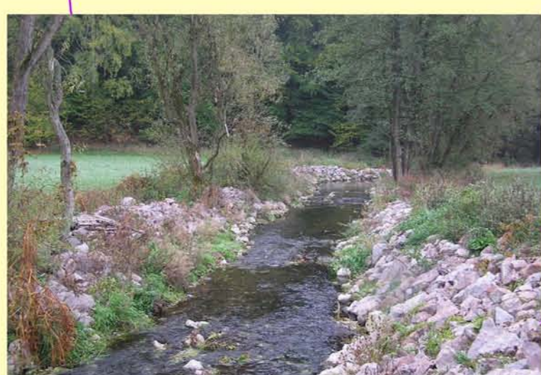
Beispiel für den Umbau eines Wehres in eine Gleite Effelder oh. Döhlau, Ersatz eines ehemaligen Bewässerungswehres durch eine flache Sohlgleite