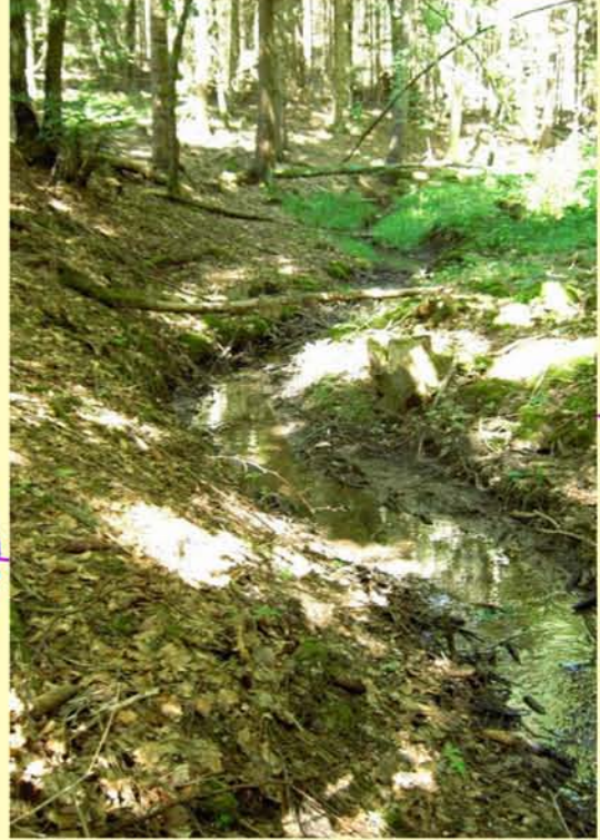
Beispiel für den Entwicklungszustand Gewässerstruktur: Hutsbach oh. Westenfeld, naturbelassener Abschnitt