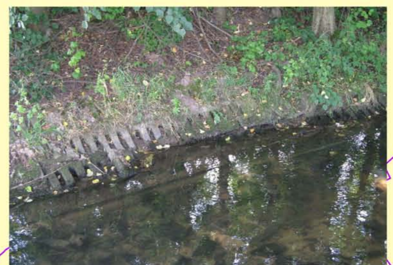
Katz uh. Mehmls, stark ausgebautes Gewässer