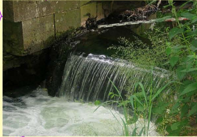
Herpf Schlabbsturz oh. Ortslage Herpf

Die raumbezogenen Basisdaten wurden vom Landesamt für Vermessung und Geoinformation bereitgestellt und werden gemäß Genehmigung Nr. 1612-00685/2007 genutzt. Nachdruck und Vervielfältigung, auch auszugsweise, nur mit Genehmigung des Herausgebers.