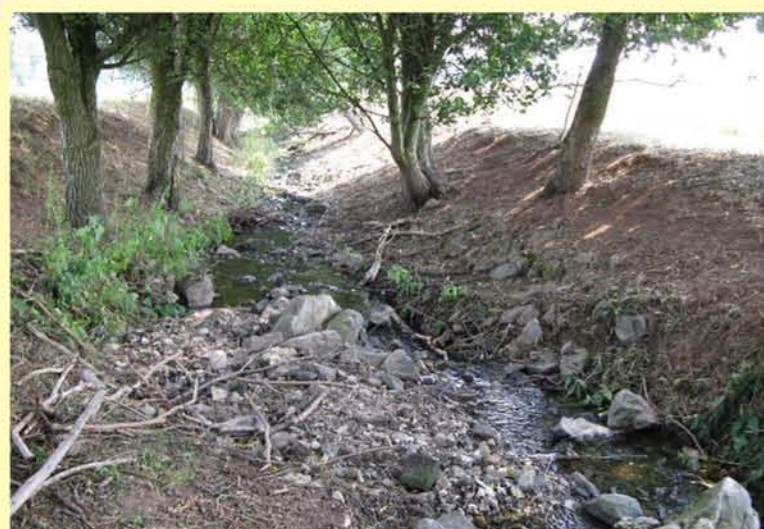
Bach aus Oepfersthausen, ausgebautes Gewässer mit landwirtschaftlicher Nutzung