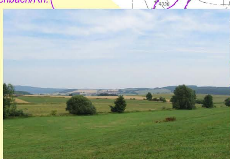
Rensbach uh. Hümpfersthausen, Gewässerrandstreifen kaum ausgebildet