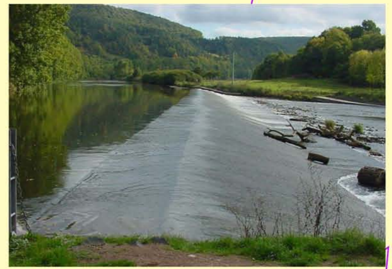
Beispiel für Querbauwerk als Wanderhindernis: Werra, Wehr in Falken