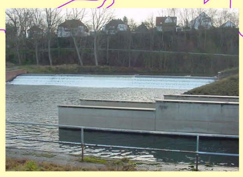
Beispiel für Querbauwerk als Wanderhindernis: Werra, Wehr in Berka