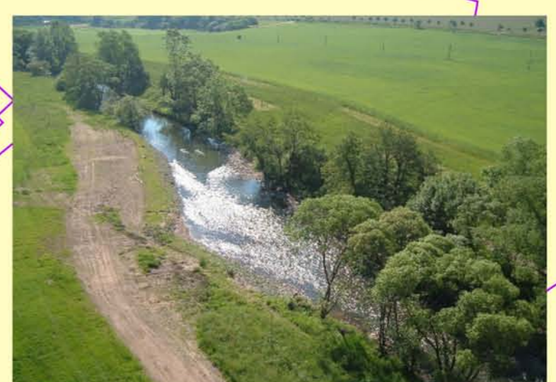
Beispiel für durchgängiges Querbauwerk: Werra, Sohlgleite am ehemaligen Wehr Gasturbinenwerk Einhausen