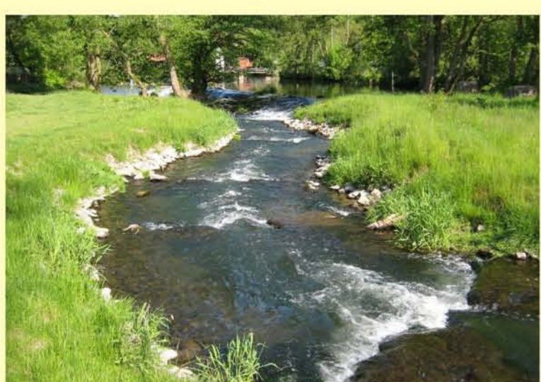
Beispiel für Querbauwerk mit Fischaufstiegsanlage: Werra, Umgehungsgerinne am Brückenmühlwehr in Vachdorf