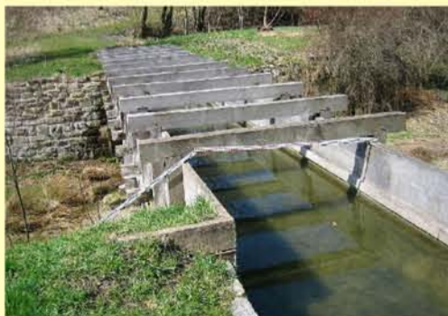
Sächsische Helbe, Westgreußen, Aquädukt