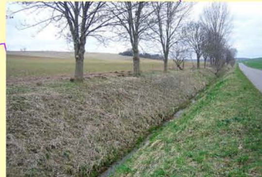
Grollbach oberhalb Greußen, begradigt und ausgebaut