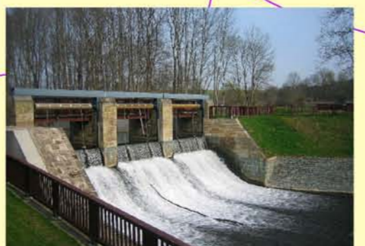
Helbe bei Westgreußen, Wehr