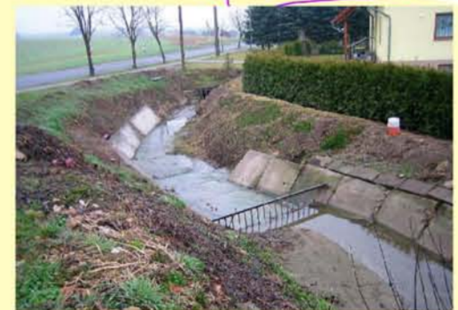
Sumpfbach, Schemberg, stark ausgebautes Gewässer