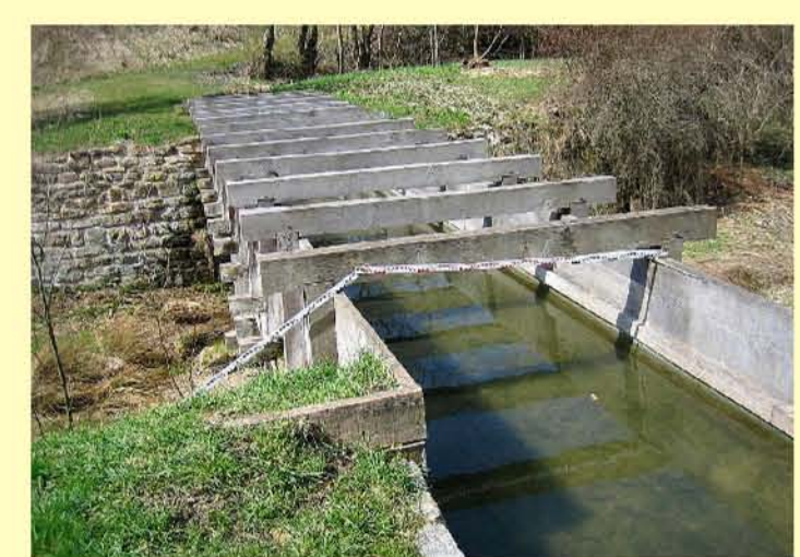
Sächsische Helbe, Westgreußen, Aquädukt