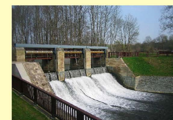
Helbe bei Westgreußen, Wehr