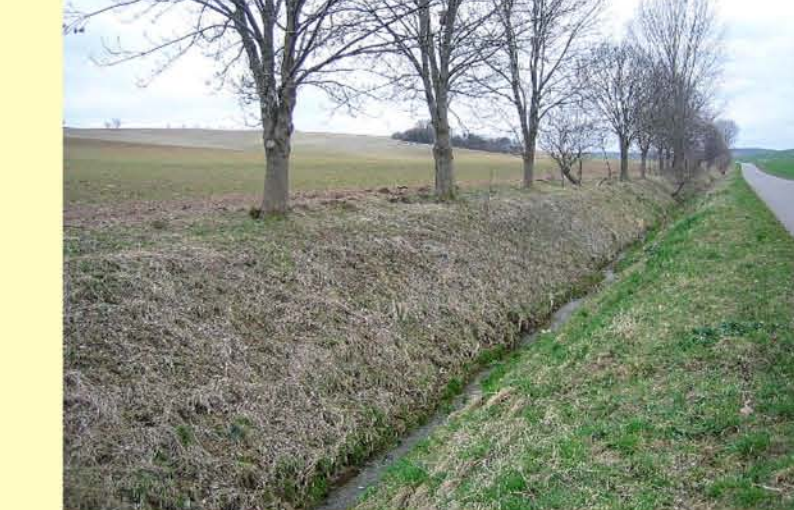
Grollbach oberhalb Greußen, begrüdet und ausgebaut