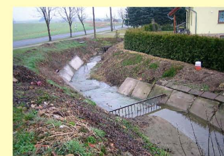
Sumpfbach, Schemberg, stark ausgebautes Gewässer