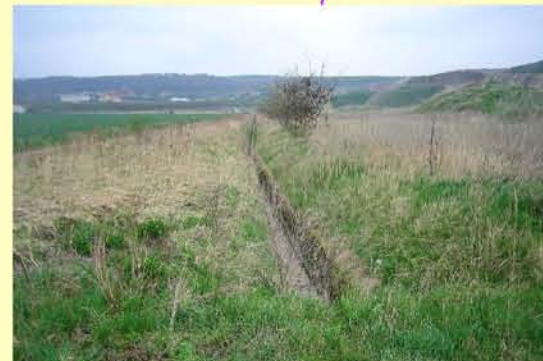
Graben vom Mühlal bei Roßleben, begradigt und stark ausgebaut