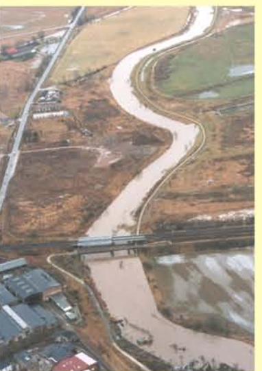
Unstrut unterhalb Artorn, Abfluss bei Hochwasser