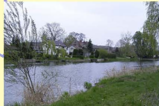
Unstrut in Artorn, oberhalb Wehr, Bebauung Uferbereich