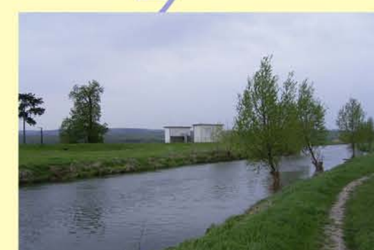
Unstrut bei Bretleben, beidseitig eingedeicht