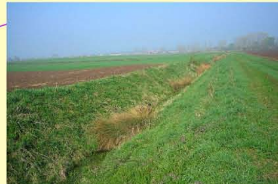
Bach aus Schönewerda, begradigt, fehlende Gehölze