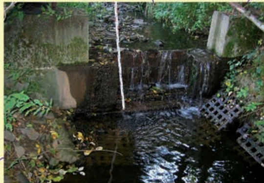
Querbauwerk bei Steinbrücken