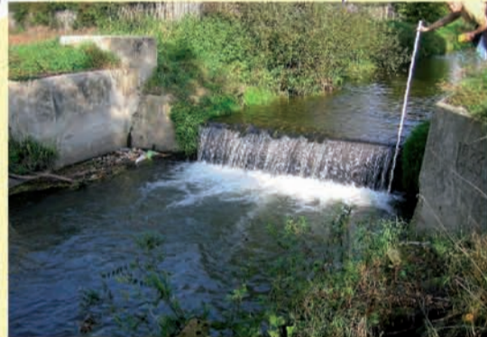
Orla, Querbauwerk bei Neunhofen