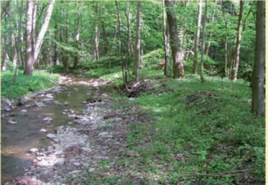
Beispiel für einen unveränderten oder nur gering veränderten Gewässerabschnitt, keine Maßnahmen erforderlich: Leutra oh. Leutra