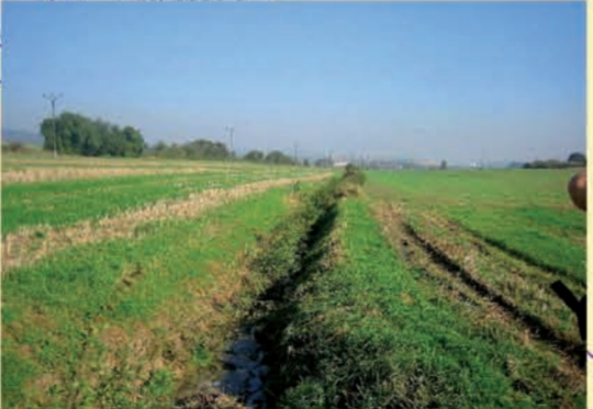
Kotschau bei Kölpna, Beispiel für einen stark begrädeten Gewässerabschnitt ohne standorttypischen Gehölzstand