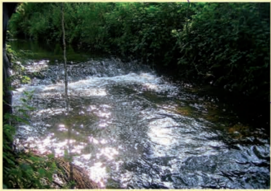
Orla, Absturz bei Rehmen