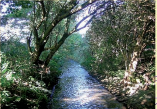
Orla bei Dreitzsch, Beispiel für ein begrädetes Gewässer mit Uferverbau