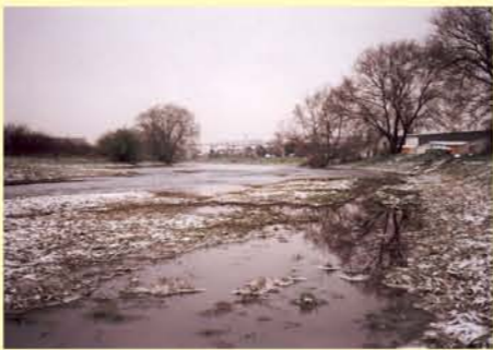
Zorge, Nordhausen Steinmühlenweg typisches Defizit- Uferverbau