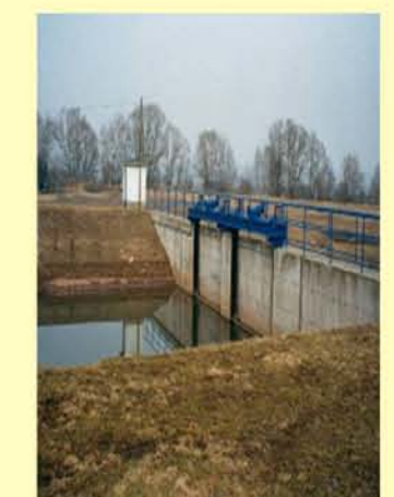
Helme Einlauf HWRB Kelbra Abschlagbauwerk, nicht durchgängig IB Meinecke

Die raumbezogenen Basisdaten wurden vom Landesamt für Vermessung und Geoinformation bereitgestellt und werden gemäß Genehmigung Nr. 1612-00565/2007 genutzt. Nachdruck und Vervielfältigung, auch auszugsweise, nur mit Genehmigung des Herausgebers.