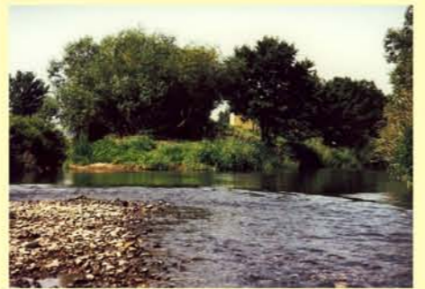
Helme, Mündung Zorge