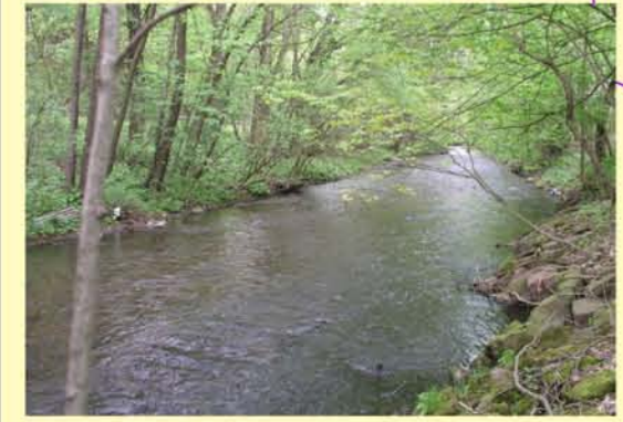
Apfelstädt oh. Georgenthal, mit naturnahem Ufergehölz-Saum, jedoch erkennbar gleichförmigem Gewässerbett