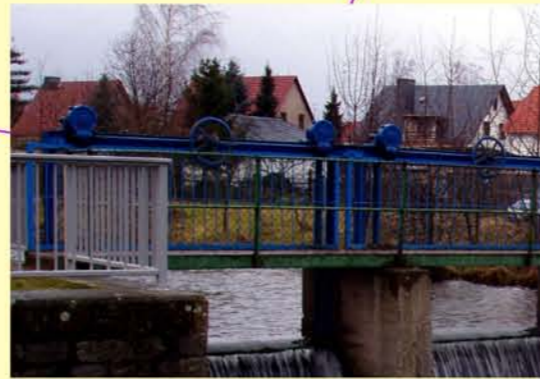
Apfelstädt, für Fische unpassierbares Wehr in Hohenkirchen

Die raumbezogenen Basisdaten wurden vom Landesamt für Vermessung und Geoinformation bereitgestellt und werden gemäß Genehmigung Nr. 1612-00585/2007 genutzt. Nachdruck und Vervielfältigung, auch auszugsweise, nur mit Genehmigung des Herausgebers.