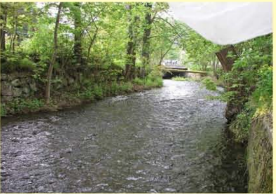
Ohra, mit Uferbefestigungen bei Luisenthal