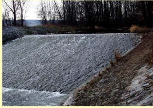
Apfelstädt oberhalb von Wechmar, unpassierbare Sohlschwelle